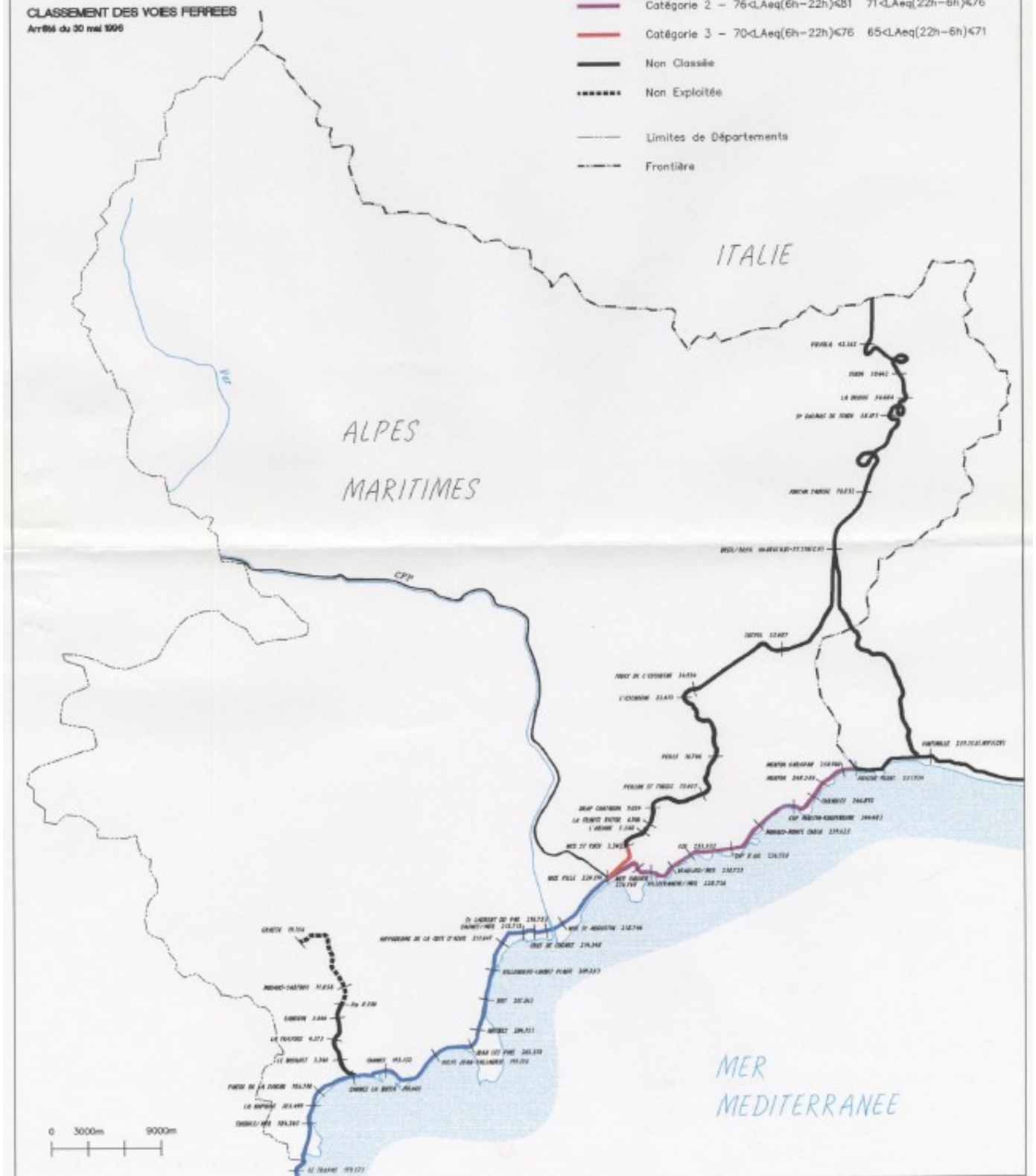
Carte des classements sonores des voies SNCF annexée à l'arrêté du 12 février 1999