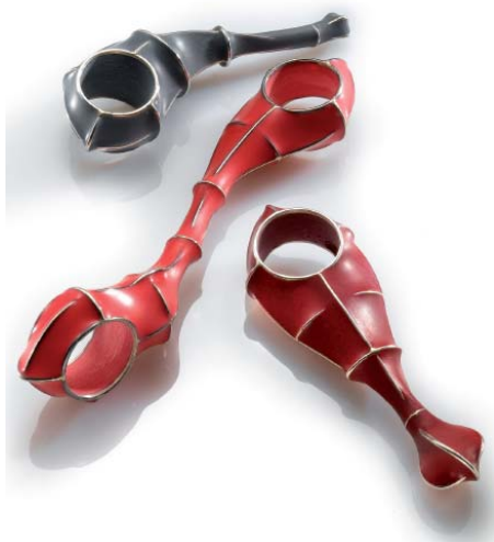
Bagues, "Gory story". Argent, plastique.

Ses travaux apparaissent régulièrement dans la presse internationale, notamment dans le domaine du design.