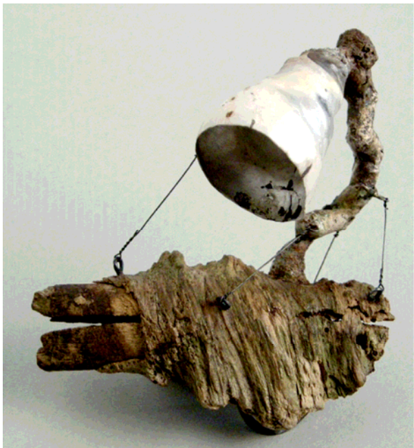
Broche, "Figure on wood". 2009.

Argent, émail, bois, acier inox, nitrate de cuivre, oxyde.