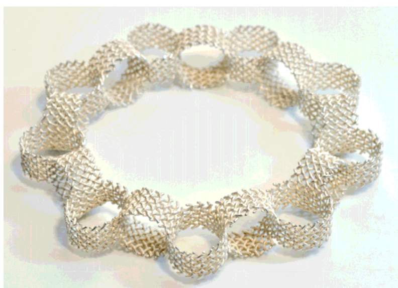
Bracelet. 2003 Argent.