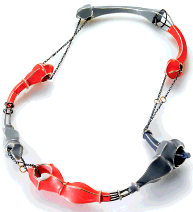
Collier "Gory story". Argent, plastique.