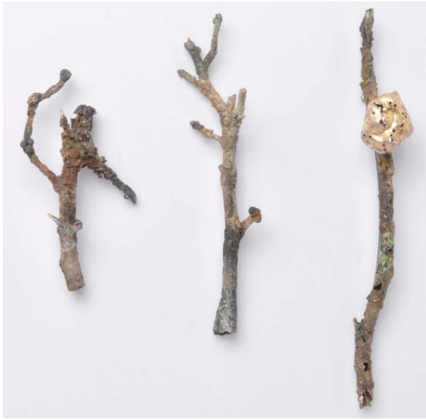
Broches, "Forgotten Things".

Bien que mes bases soient issues des techniques traditionnelles d'orfèvrerie, j'ai développé mes propres façons de traiter la surface, la forme et la couleur de mes pièces.