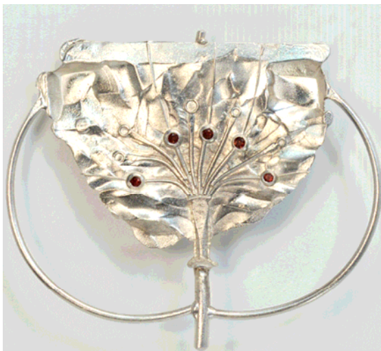
Broche, " How Many Is One " , 2003. Argent, pierres fines.

Couronnées par plusieurs récompenses internationales, ses œuvres sont présentées dans des collections de musées et des collections privées partout dans le monde.