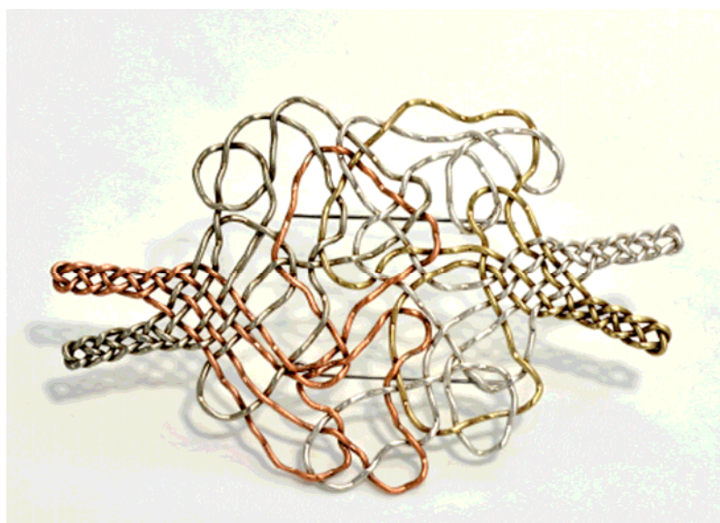
Broche, "Loops". 2010. Argent, cuivre, laiton, alpaka, acier inox.

Ses travaux sont présents dans les collections permanentes de divers musées, comme le Musée d'Israël, le Musée des Arts Décoratifs de Paris et la Pinakothek der Moderne de Munich.