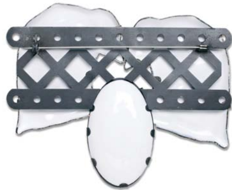
"Ice times" - Broche recto et verso - 2008 Email, cuivre, acier recyclé, argent - 110 x 140 x 19 mm