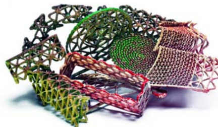
"Redder than Green", broche - 2009 Argent, poudre, peinture, galvanisation - 75 x 112 x 50 mm