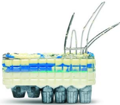
"The 14th Miniature Garden of the Unknown General" Broche - 2009 Argent 925, monel, résine polyuréthane, résine époxy 85 x 76 x 25 mm