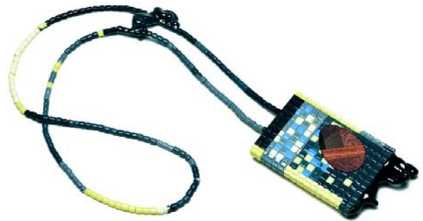
"Landing Platform for a Cricket, collection of the Chequered Princess" - Tour de cou - 2009 Résine polyuréthane, résine époxy, bois, soie 580 x 70 x 25 mm