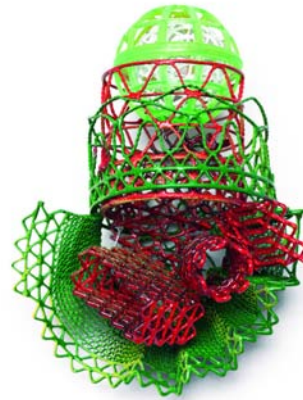
"Redder than Green" - Broche - 2009 Argent, poudre, peinture, galvanisation - 123 x 93 x 63 mm