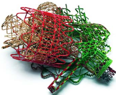
"Redder than Green" - Broche - 2009 Argent, poudre, peinture, galvanisation - 126 x 119 x 80 mm