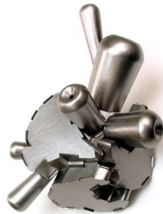
“Radiating from, through, behind” - Broche - 2008 Monel, acrylique, acier inoxydable - 100 x 65 x 40 mm