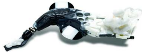
"Cat Fish #1" - Broche - 2008 Argent 925, monel, résine polyuréthane, résine époxy 110 x 50 x 35 mm