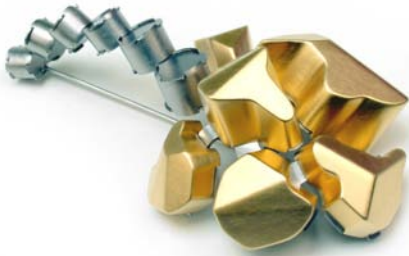
“Village of golden teeth with tail” - Broche - 2008 Monel, acrylique, acier inoxydable - 95 x 60 x 35 mm

oxy Simon Cottrell ne cherche pas à communiquer avec le monde extérieur. Son œuvre se suffit à elle-même et il considère que rien ne stimule la création plus que le processus de création lui-même. Les œuvres qu'il a réalisées au cours des huit dernières années sont particulièrement représentatives de la nature de son processus créatif personnel. Cottrell utilise les forces pré-cognitives pour donner forme à un processus de création intuitive où l'imagination peut s'exprimer sans contrainte. Ses œuvres s'intègrent et évoluent au sein d'une composition globale de la même manière qu'une idée germe et se développe au sein de notre cerveau. Formes statiques, elles explorent le champ des possibilités et se complexifient sans cesse. Simon Cottrell cherche à attiser la curiosité du spectateur en évoquant des formes familières en perpétuelle évolution. Le regard observe d'abord l'œuvre dans son ensemble puis s'attache invariablement à la myriade de détails qui la composent.