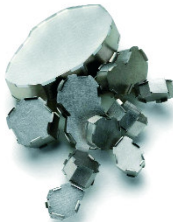
“Awkward Profile” - Broche - 2006 Monel, acrylique, acier inoxydable - 95 x 60 x 25 mm