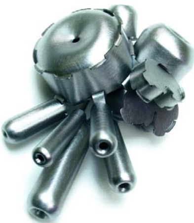
Monel, acrylique, acier inoxydable - 70 x 55 x 35 mm