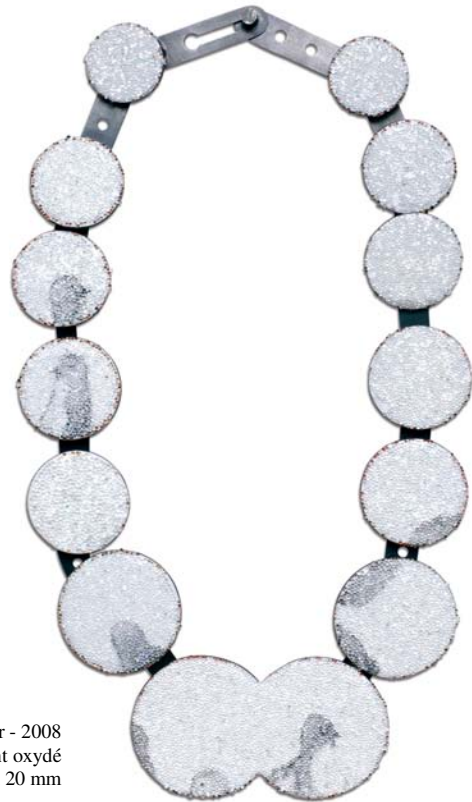
"Ice colony" - Collier - 2008 Email, perles réfléchissantes, cuivre, argent oxydé 260 x 140 x 20 mm