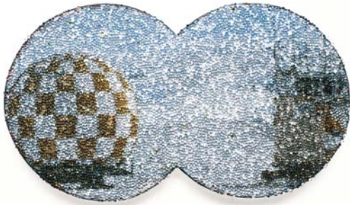
"Ice air field" - Broche - 2008 Email, transfert de photo, perles réfléchissantes, cuivre oxydé, argent, acier - 75 x 130 x 15 mm

Kirsten Haydon , née en Nouvelle-Zélande, est revenue transformée d'un séjour de 12 jours en Antarctique effectué sur une invitation de l'association Australian Antarctic Arts Fellowship. Cette expérience unique lui a fait prendre conscience de l'impact des humains sur un environnement aussi fragile que l'Antarctique, un monde dont chaque parcelle de paysage est construite à partir de minuscules cristaux de glace. On retrouve cette fascination pour les vastes étendues du continent glacé dans les œuvres de Kirsten Haydon, qui réinterprète pour nous l'héritage historique et personnel de l'Antarctique.