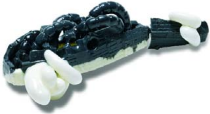
"Infested Carp" - Broche - 2008 Argent 925, monel, résine polyuréthane, résine époxy 100 x 50 x 35 mm