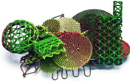
"Redder than Green" - Broche - 2009 Argent, poudre, peinture, galvanisation - 75 x 115 x 42 mm

Robert Baines utilise des structures complexes pour créer des formes et des surfaces. Il capture l'espace grâce à ses systèmes en fil de fer et à ses réseaux linéaires. Ses œuvres transcendent le formalisme historique par l'application de touches de couleur et de peinture.